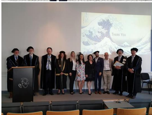
Participare în comisii de doctorat în străinătate. Universitatea Edinburgh, UK 2016 (fotografia de sus) și Universitatea Ghent, Belgia, 2019 (fotografia de jos), unde alături de membrii comisiei în fotografie sunt proaspătul doctor și familia sa.