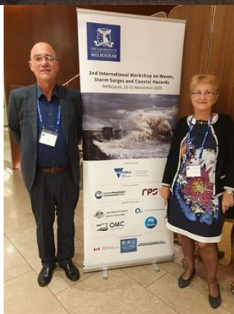
Participări la conferința ICACER 2015, Bangkok, iar jos workshopul international din Melbourne, 2019.