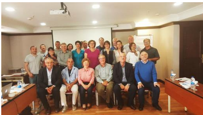
Participare ca expert internațional la ședința de lucru a proiectului European EMODNET – European Marine Observation and Data Network, the Black Sea Check Point, Istanbul, Turcia, 2018.