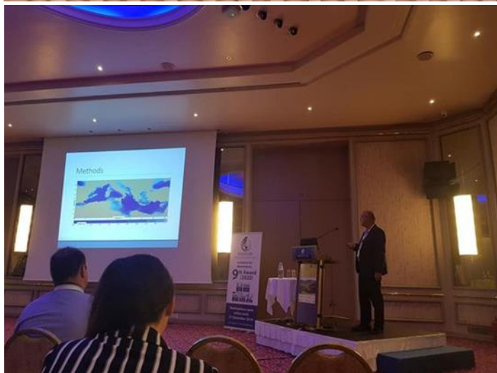
Participare la a conferința CEST2019 (16 th International Conference on Environmental Science and Research), 4-7 septembrie 2019, insula Rodos, Grecia.