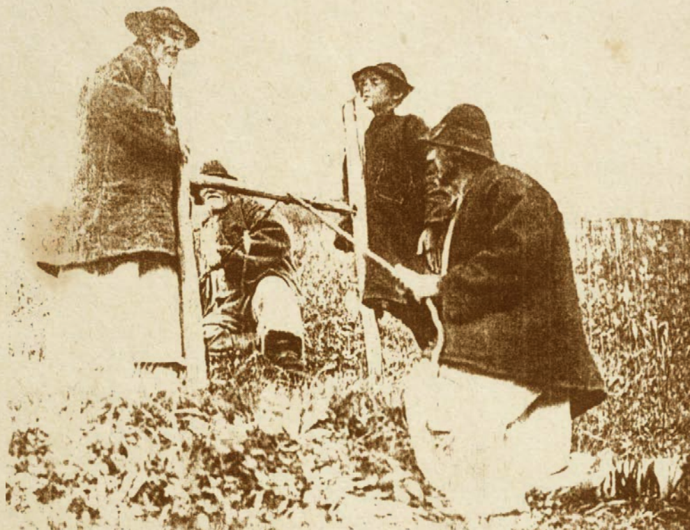
Aprinderea focului viu la o stână din Munții Rodnei, foto din Tiberiu Morariu, Viața pastorală în munții Rodnei , 1937

În unele locuri oamenii făceau un foc mare, reprezentând focul viu , element pirc încadrat unui complex mitico-ritual solar mai extins (se făcea foc viu de Lăsatul Secului, de Sânziene, de Sfântul Dumitru etc.), aprins de doi copii, un băiat fără tată și o fată fără mamă, peste care săreau oamenii, dar și animalele domestice, pentru a fi ferite de boli și de moarte.