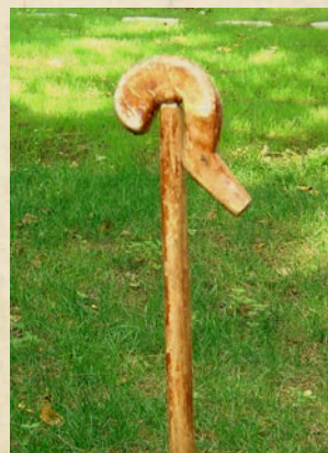
Foto stânga – Cârlibane (cârliche păstorești), cu capete de metal simbolizând șarpele, la stâna de pe muntele Cajup, regiunea Gjirokastra, Albania, foto Emil Țircomicu, 2016