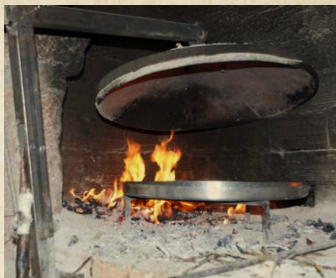
Foto stânga – Cuptor ( cireap ) cu pâine la copt, Muzeul Gh. Celea, M. Kogălniceanu, jud. Constanța, foto Emil Țîrcomnicu, 2007