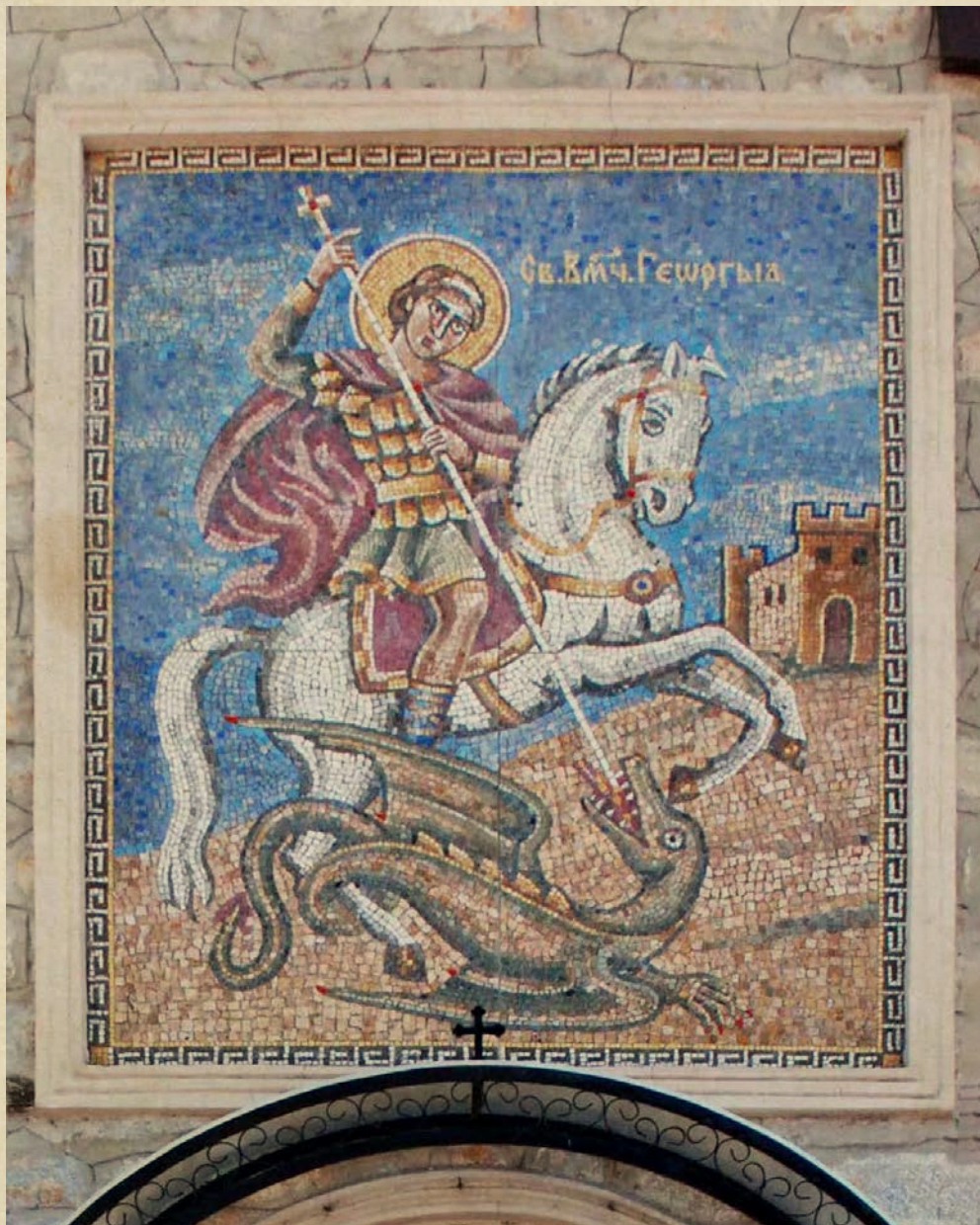
Reprezentarea Sfântului Gheorghe, mozaic, biserica Sf. Gheorghe din Ohrid, R. Macedonia de Nord, foto Emil Țircomicu, 2018