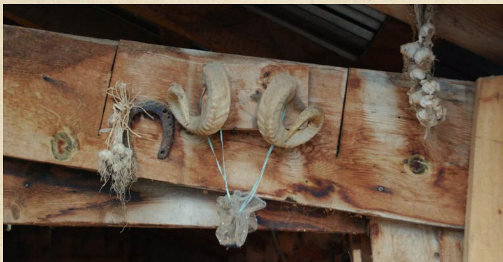
Amulete pentru protecția gospodăriei, Grabova, regiunea Gramsh, Albania, foto Emil Țircomnicu, 2018

toate vitele din ogradă se stropeau cu apă și se afumau pentru sănătate, după ce în ajun fuseseră închise pentru a nu le fi luată, de spiritele nocive, mana laptelui, entități deosebit de active în acest timp marcat de sacralitate.